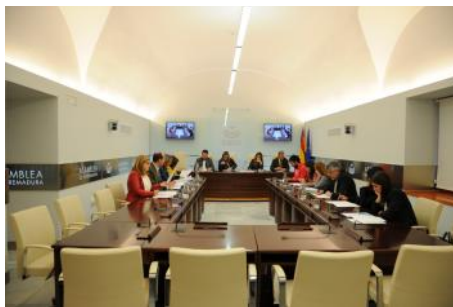
Imagen de una reunión de la Junta de Portavoces IX Legislatura

3. En el proceso de calificación y admisión a trámite de las iniciativas, incluyendo los escritos de reconsideración, en los términos previstos por el Reglamento.