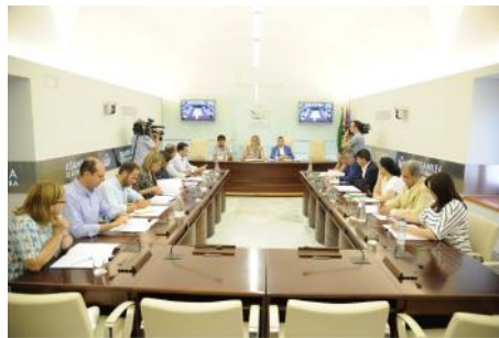
Imagen de la sesión constitutiva de la Diputación Permanente IX Legislatura