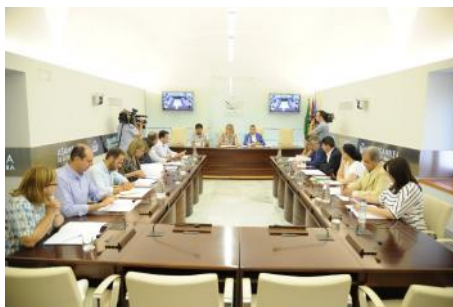
Imagen de la sesión constitutiva de la Diputación Permanente IX Legislatura