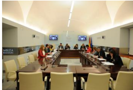
Imagen de una reunión de la Junta de Portavoces IX Legislatura

3. En el proceso de calificación y admisión a trámite de las iniciativas, incluyendo los escritos de reconsideración, en los términos previstos por el Reglamento.